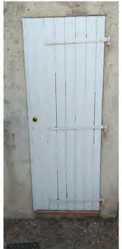
Porte local annexe ----->