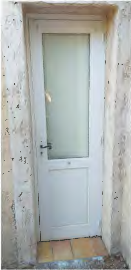
<----- Porte d'entrée